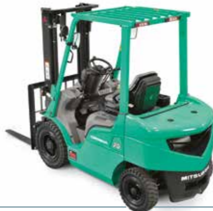
GRENDIA ES Série FD15-35(C)N Diesel 4 roues sur PPS 1500 – 3500 kg