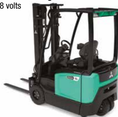
EDIA EM Série FB14-20A(C)NT Electrique 3 roues sur PPS 1400 – 2000 kg 48 volts