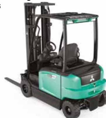
EDIA EM Série FB16-20A(C)N Electrique 4 roues sur PPS 1600 – 2000 kg 48 volts