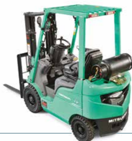
GRENDIA ES Série FG15-35(C)N Gaz 4 roues sur PPS 1500 – 3500 kg